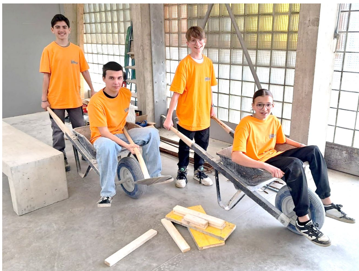
Elèves de 10CO Construction des éléments pour la future cour verte

En route vers une nouvelle année scolaire... Bienvenue !